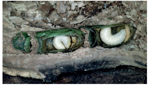
Geöffnete Brutzellen der Blattschneiderbiene Megachile willughbiella in Totholz.

Das Errichten von traditionellen Wildbienenhotels mit hohlen Pflanzenstängeln und Bohrlöchern in Hartholz leistet alleine aber nur einen bescheidenen Beitrag zur Förderung einer artenreichen Wildbienenfauna. Höchstens ein Viertel der gesamten Wildbienenfauna bewohnt solche