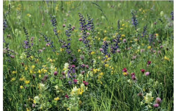
Blüten- und artenreicher Halbtrockenrasen als wichtiger Lebensraum für Wildbienen auf Nahrungssuche.