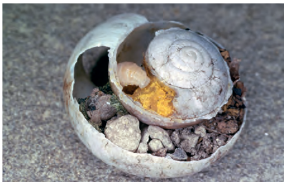
Die Sandbiene Andrena florea gehört zu den am stärksten spezialisierten Wildbienenarten; sie sammelt den Pollen ausschliesslich auf Zaurrübe (oben). Einzelliges Nest der Mauerbiene Osmia bicolor in einem leeren Schneckenhaus (unten).

Für die Verproviantierung der Brutzellen fliegen die Wildbienenweibchen unermüdlich zwischen Nest und Nahrungspflanzen hin- und her. Je nach Bienenart sind bis 50 Pollensamflüge notwendig, um einen einzigen Nachkommen mit genügend Pollenproviant zu versorgen. Es müssen nämlich riesige Pollenmengen gesammelt werden. Oftmals wird der gesamte Pollengehalt von mehreren hundert Blüten benötigt, um einen einzigen Nachkommen zu verköstigen. Es erstaunt daher wenig, dass Wildbienenweibchen während ihrer nur wenige Wochen dauernden Fortpflanzungsperiode auch bei gutem Nahrungsangebot und idealen