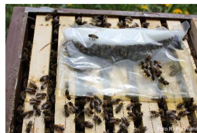
Magazin (Futterteig direkt auf Wabenschenkeln)