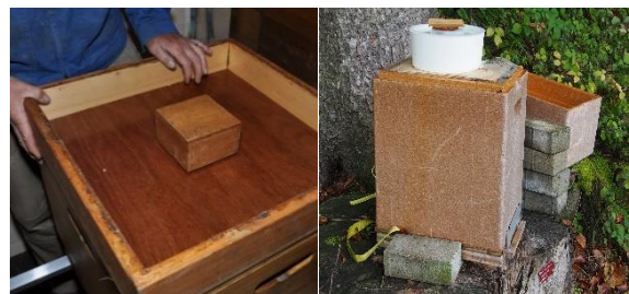
Magazin (2 verschiedene Futtergeschirre)